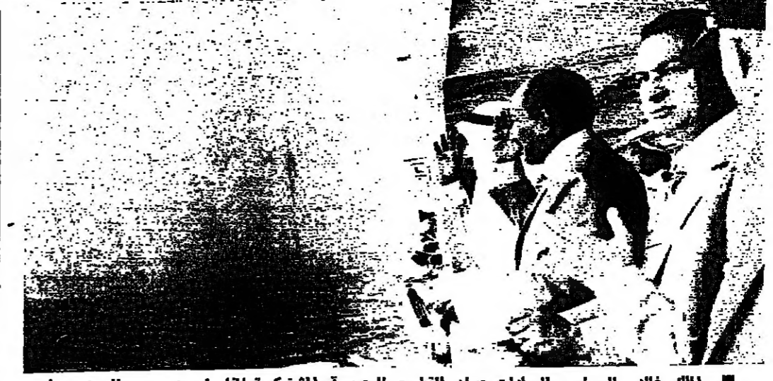
الملك خالد والرئيس السادات يجييان القمم البحرية المشتركة بالقاهرة ، ويبدو السيد حسني مبارك نائب رئيس الجمهورية المصرية